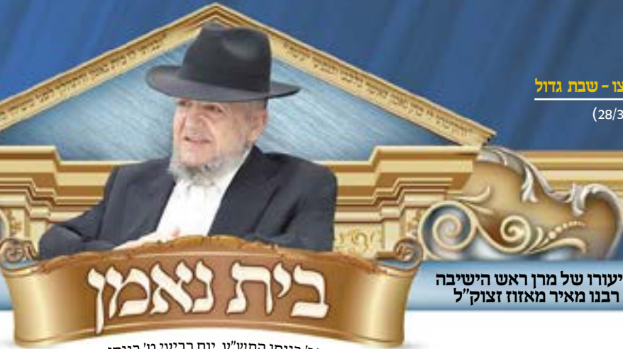
בבית הכנסת "אהבת התורה - איש מצליח" רחוב הרב עוזיאל 43 ב"ב.